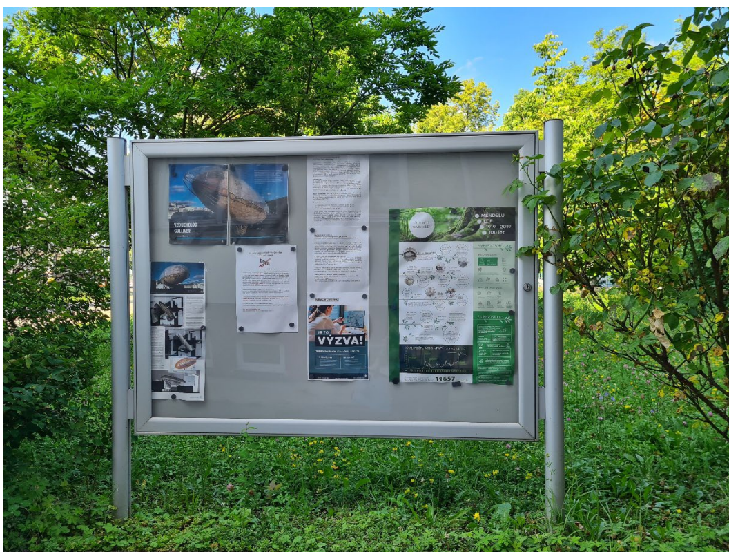
Obr. 7 – Detailní pohled na 1 ks stávající vitríny u betonové kamenné zídky