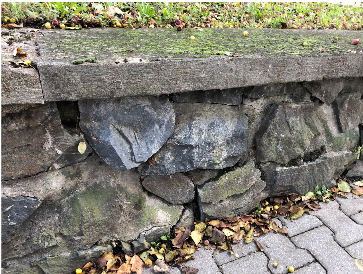
Obr. 5 – Detailní pohled na část řešené kamenné zídky