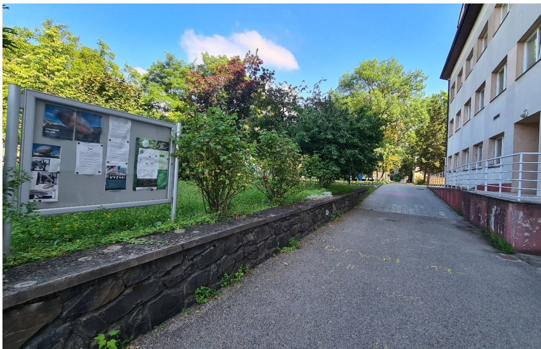
Obr. 6 – Pohled na 1 ks stávající vitrína u betonové kamenné zídky