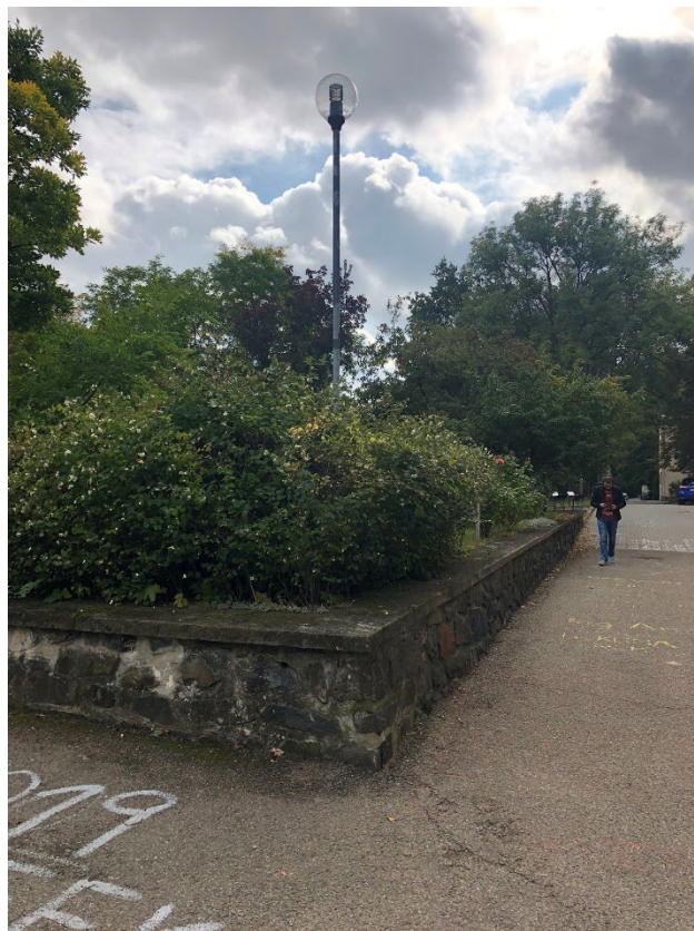
Obr. 2 – Pohled na řešenou kamennou zídku