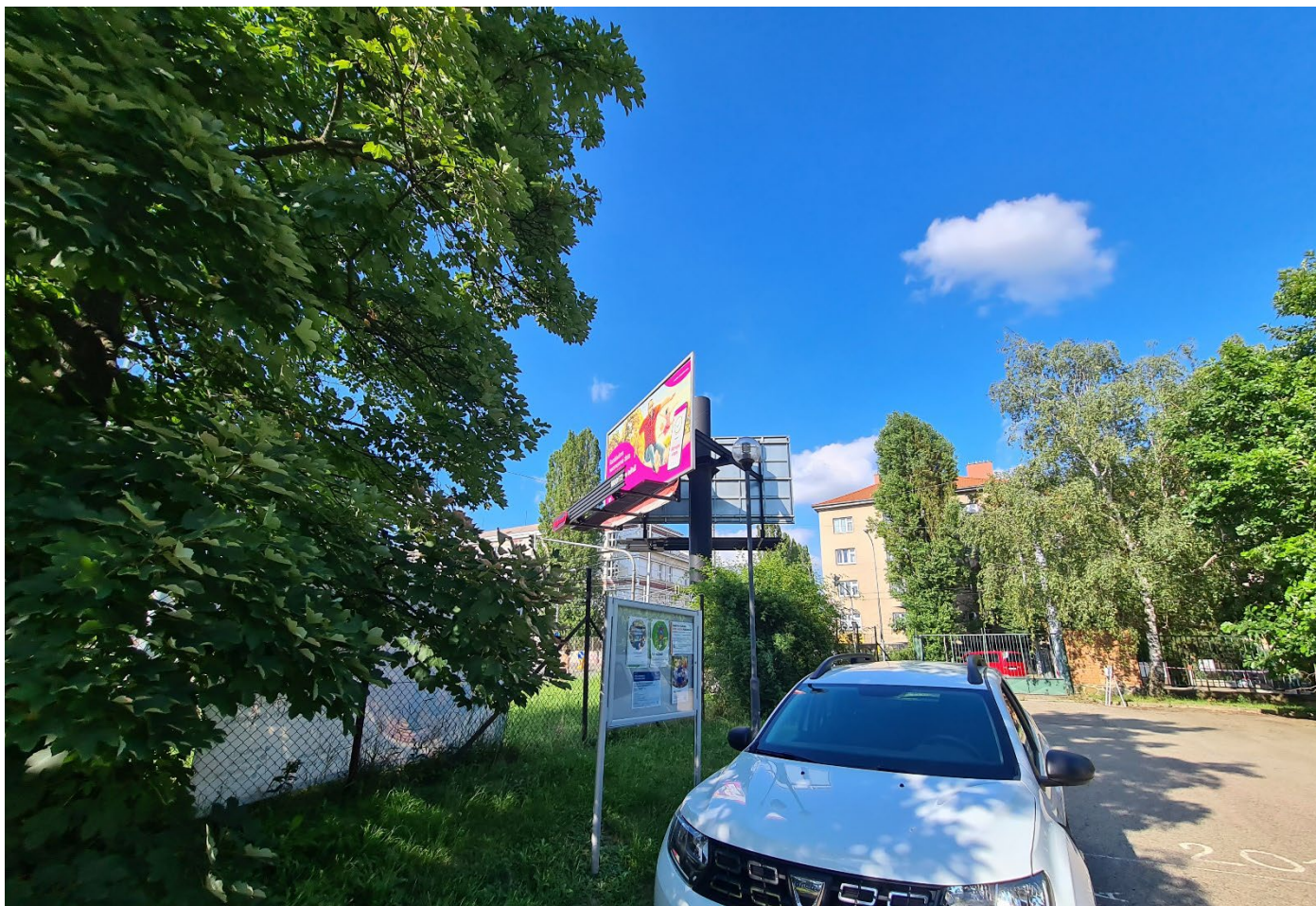
Obr. 8 – Pohled na 1 ks stávající vitrína u pletivového oplocení