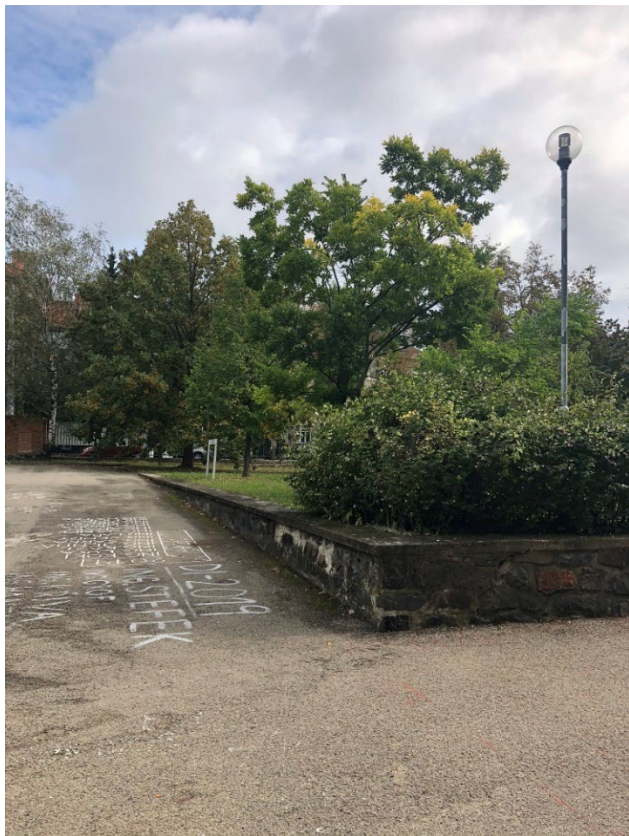
Obr. 1 – Pohled na část řešené kamenné zídky