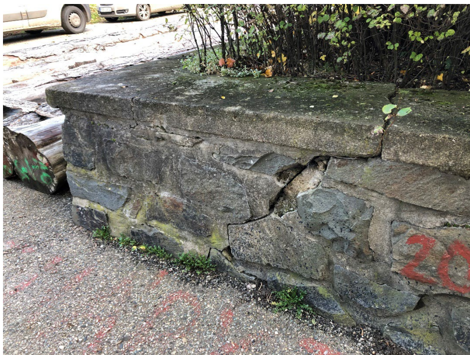
Obr. 4 – Pohled na rohovou část řešené kamenné zídky