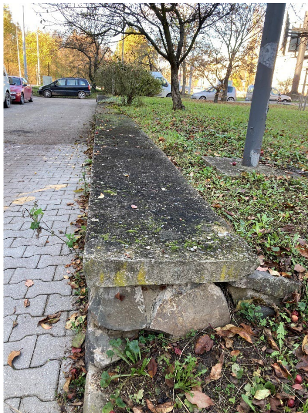
Obr. 3 – Pohled na část řešené kamenné zídky